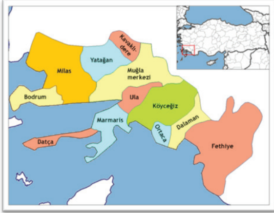
Şekil 2. Muğla İli İlçeleri Lokasyon Haritası [17]

Ortaca ilçesinin kapsadığı topraklar MÖ. 336 ve 323 yılları arasında Makedonya Kralı Büyük İskender tarafından fethedilerek Makedon toprakları haline gelmiştir. Daha sonra bir dönem Mısır Kraliçesi Kleopatra'nın egemenliğinde kalan bölge MÖ 192 yılından itibaren Roma İmparatorluğu egemenliğine girmiştir. 1071 sonrası Anadolu'da Türk egemenliği dönemine kadar da önce Roma, sonra Doğu Roma egemenliğinde kalmıştır [15].